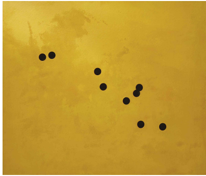
Sense títol , 2005

Ptge Mercader 12, bxs – 08008 Barcelona – TF: 93 595 14 82 – FX: 93 250 63 58 info@galeriamarcdomenech.com – www.galeriamarcdomenech.com