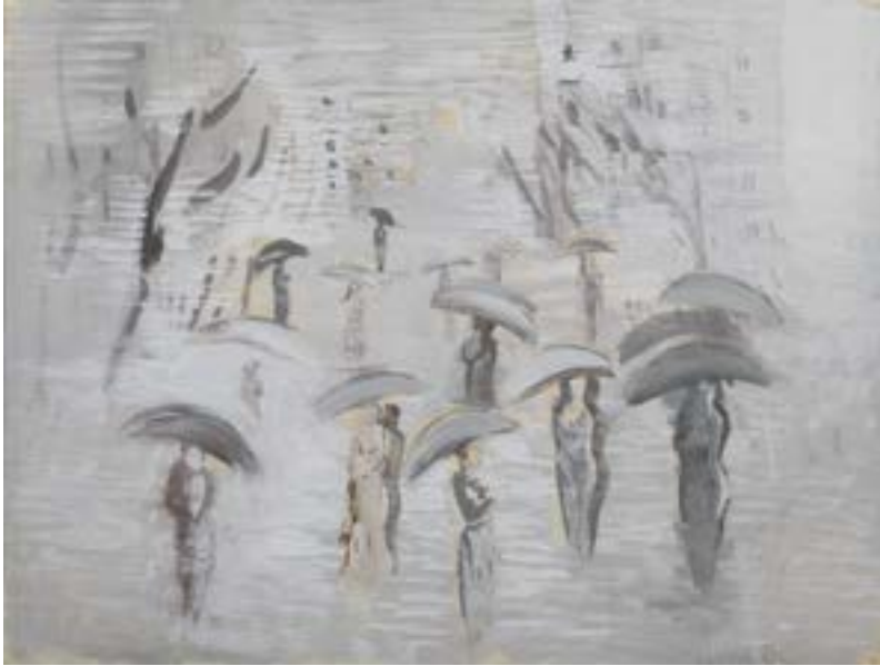
5. Paisaje urbano con paraguas (La Rambla, Barcelona), c. 1931