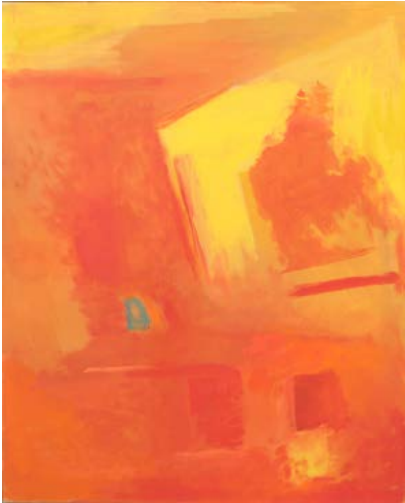
36. Sin título, núm. 6, 1998 Óli damunt tela. 132,1 x 106,7 cm Óleo sobre tela. 132,1 x 106,7 cm