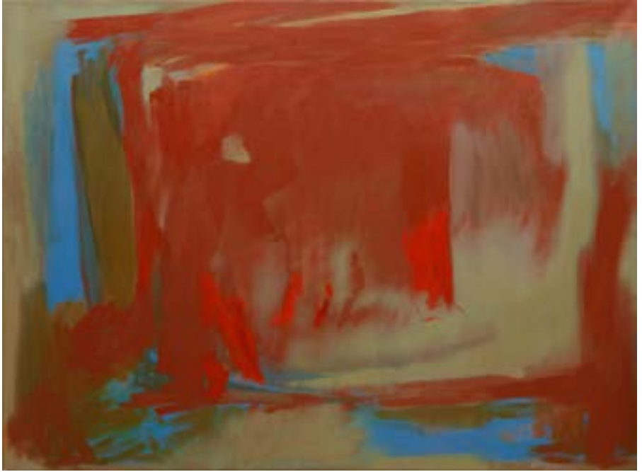
28. Composición, 1992 Oli damunt tela. 125 x 167 cm Óleo sobre tela. 125 x 167 cm