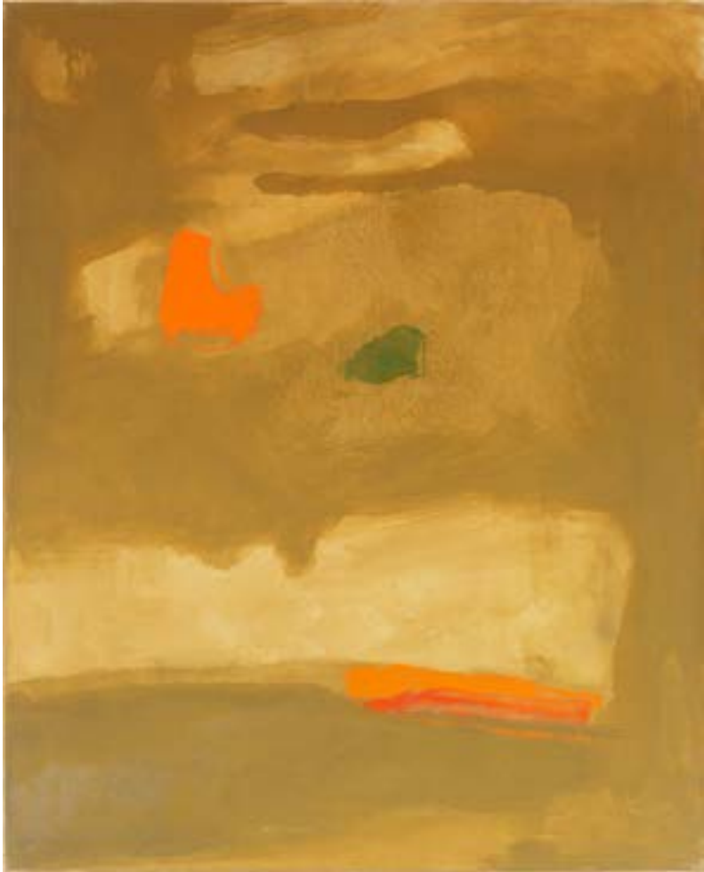
34. Ochre Light, 1995 Óli damunt tela. 101,6 x 81,3 cm Óleo sobre tela. 101,6 x 81,3 cm