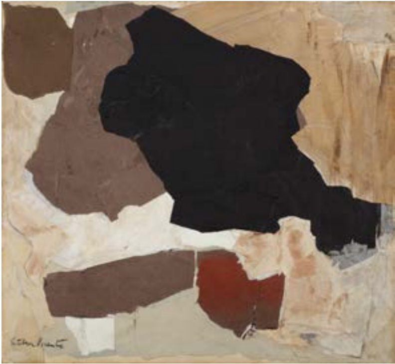
9. Black and White, 1961 Collage damunt tela. 60 x 65 cm Collage sobre tela. 60 x 65 cm