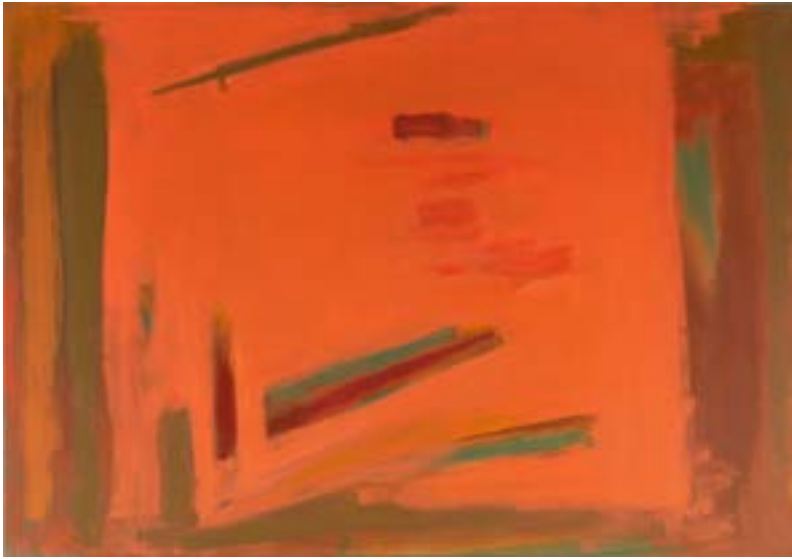
24. Vibrant Harmony , 1991 Óli damunt tela. 88,9 x 127 cm Óleo sobre tela. 88,9 x 127 cm