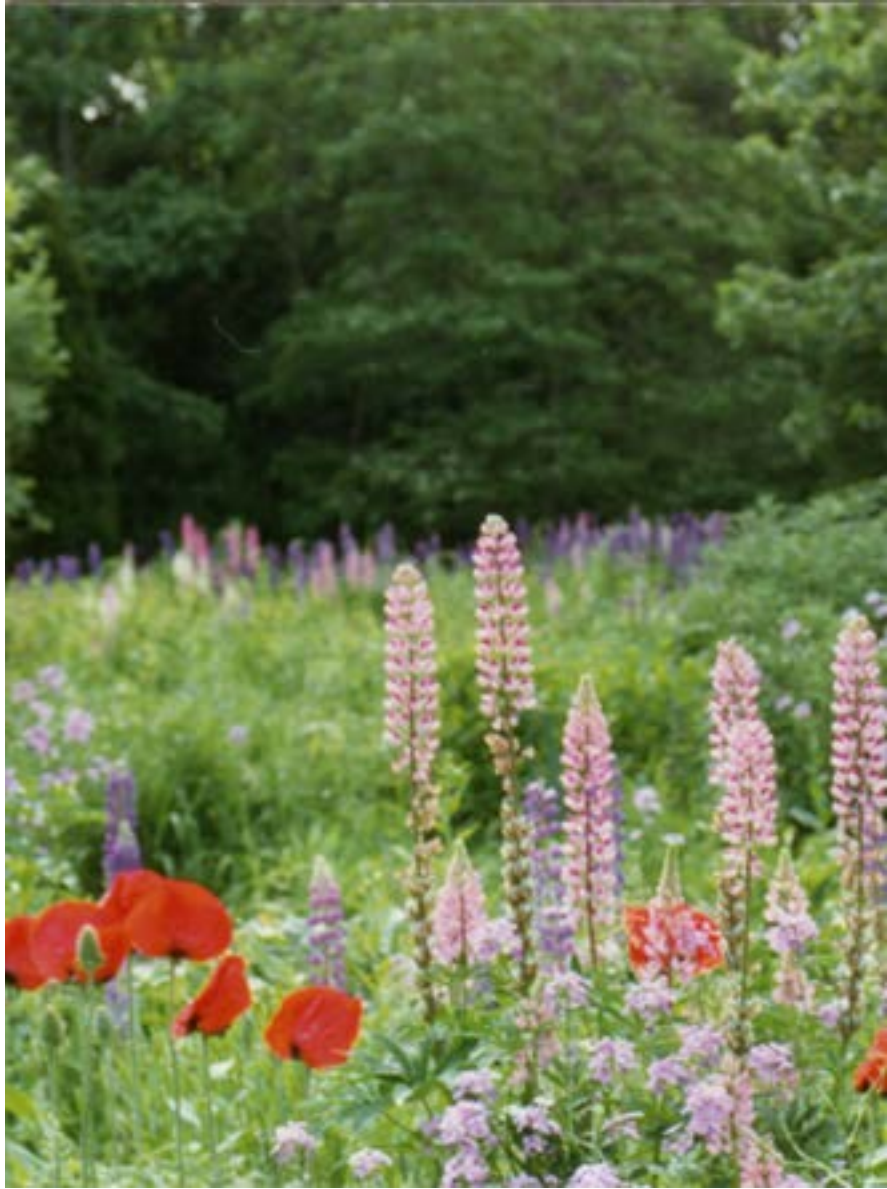
Esteban Vicente en el jardín, c. 1980-1990, Bridgehampton, NY Cortesía de The Harriet and Esteban Vicente Foundation.