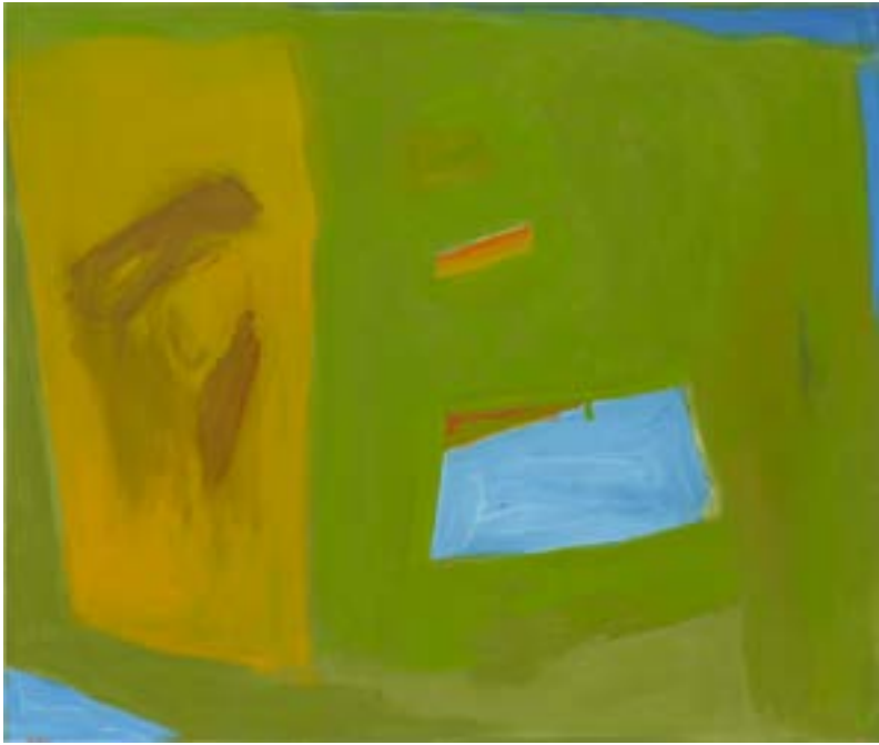
29. Sound, 1992 Óli damunt tela. 81,3 x 96,5 cm Óleo sobre tela. 81,3 x 96,5 cm