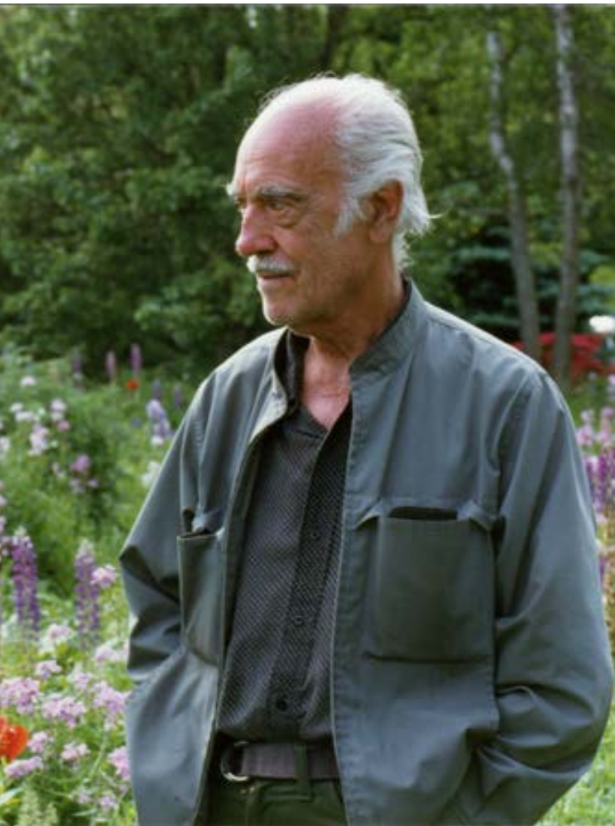
Esteban Vicente al jardí, c. 1980-1990, Bridgehampton, NY Cortesia de The Harriet and Esteban Vicente Foundation.