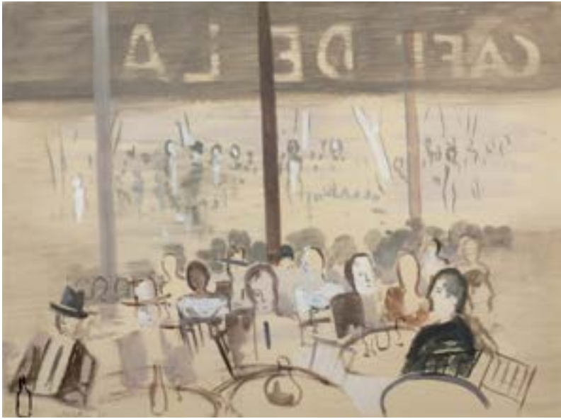
4. El Café de la Rambla , 1931 Guaix damunt paper. 48 x 64 cm Gouache sobre papel. 48 x 64 cm