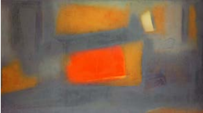
20. Interior, 1987 Oli damunt tela. 91,5 x 163 cm Óleo sobre tela. 91,5 x 163 cm