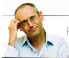
Ricard Mas Peinado

Enric Planasdurà (Barcelona, 1921-1984) és un dels pocs artistes catalans contemporanis que han tractat a fons la geometria. La galeria Oriol li ha dedicat una antològica que abasta el període 1949-1974, a través del qual podem endevinar les seves evolucions d'un surrealisme amb troballes cubistes fins a la geometria de síntesi, tot passant per una etapa informalista, durant la dècada dels 60.